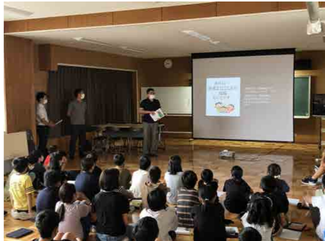
森上小学校 (未来世代育成委員会)

また、4月に定時総会、5月に県連期首役員会がコロナ禍による制限の中開催されました。8月には県連夏期役員会、9月には定時総会と立て続けに重要な会議も控えております。私自身、初めての理事で委員長を仰せつかり至らぬ点もあるかもしれませんが、総務委員会一同、全力で全ての事業に取り組みで参ります。宜しくお願ひいたします。