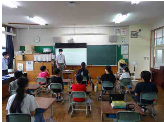
豊丘小学校キックオフセミナー (未来世代育成委員会)