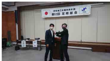
第52回定時総会 (総務委員会)