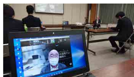
会員研修会 (広報企画委員会)